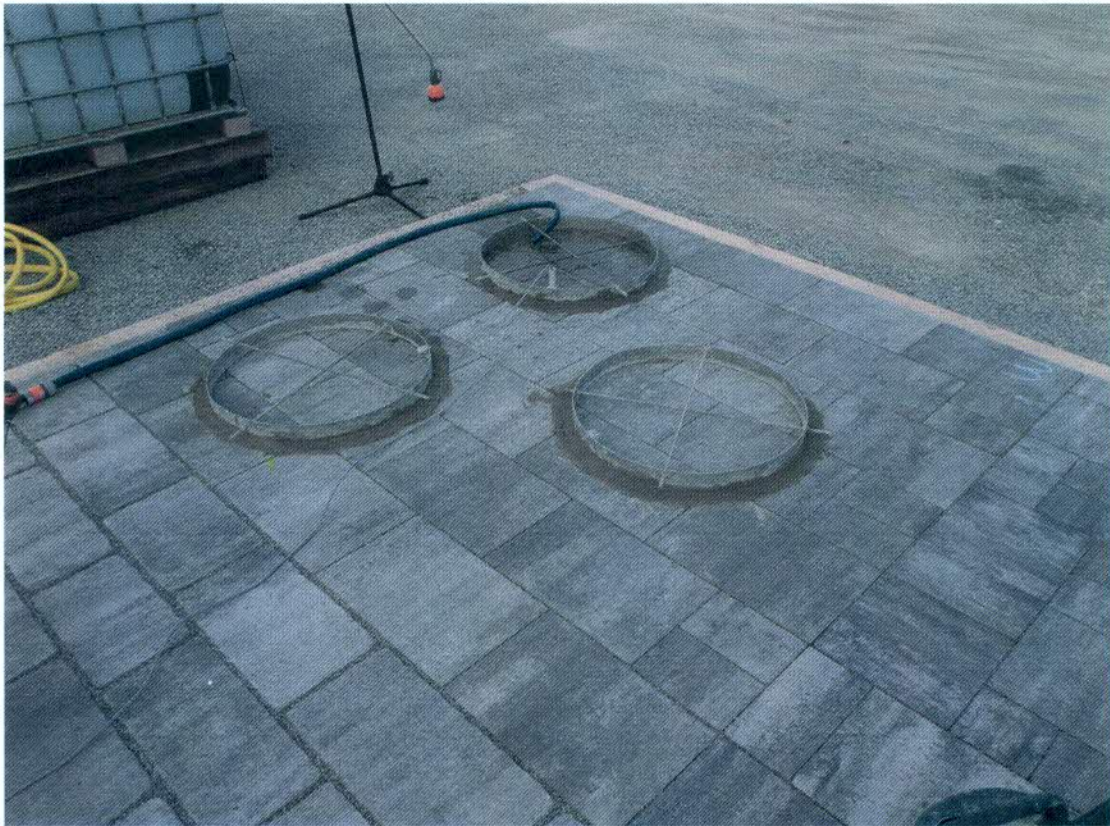
Bild: Caldera 8 cm, grau nuanc. Läuferverband 400x266 mm