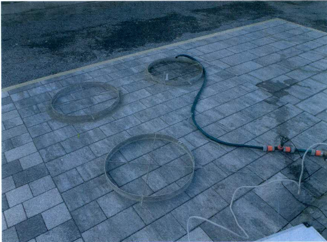
Bild: Via Caesaro 8cm, Platin, Römischer Verband