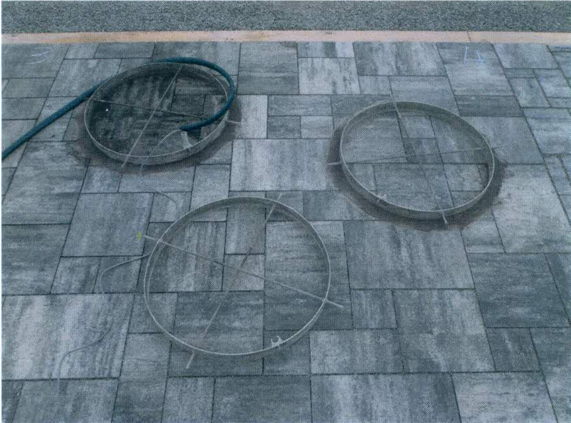
Bild: Via Caesaro 8cm, Platin, Römischer Verband