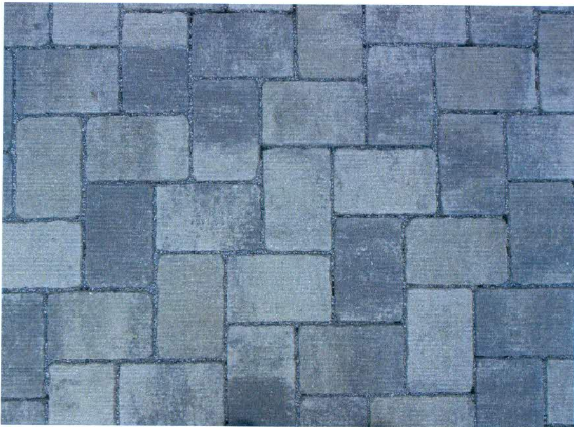
Verlegebild Fischgrätverband