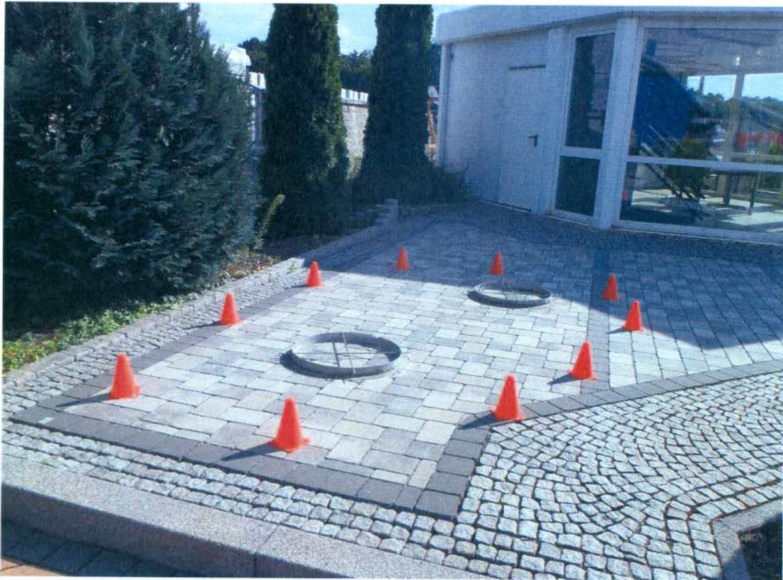
Bild: Nemaninga, gealtert, Fischgrätverband