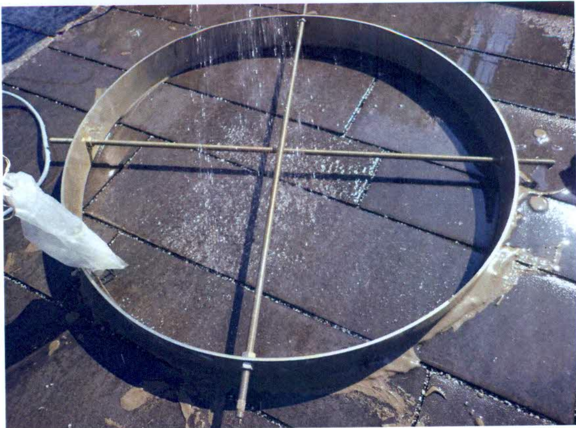
Bild: Brickado Graphit, 2 Formate, Versuchsdurchführung