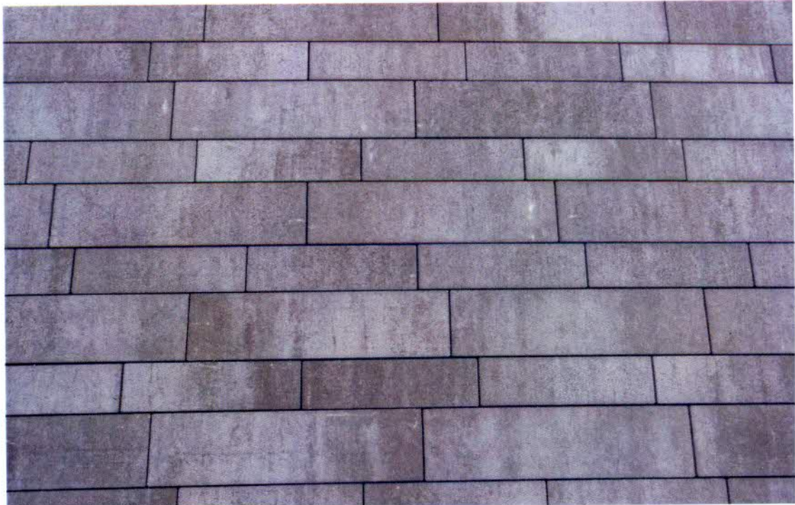
Bild: Brickado Graphit, Verlegebild