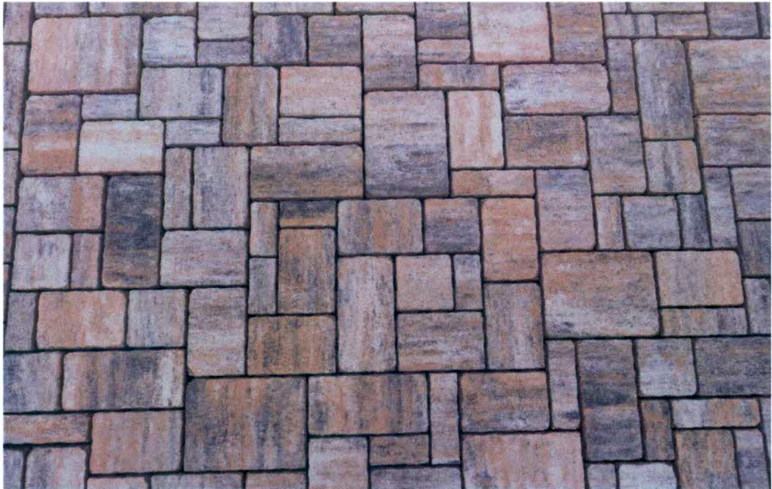
Bild: Culto Muschelkalk gealtert, Verlegebild