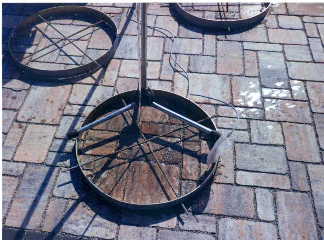
Bild: Culto Muschelkalk gealtert, 6 Formate, Versuchsdurchführung